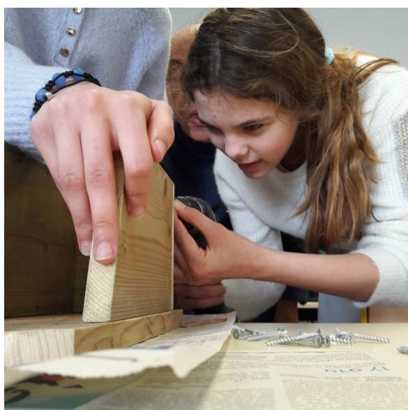
L'assemblage et le vernissage